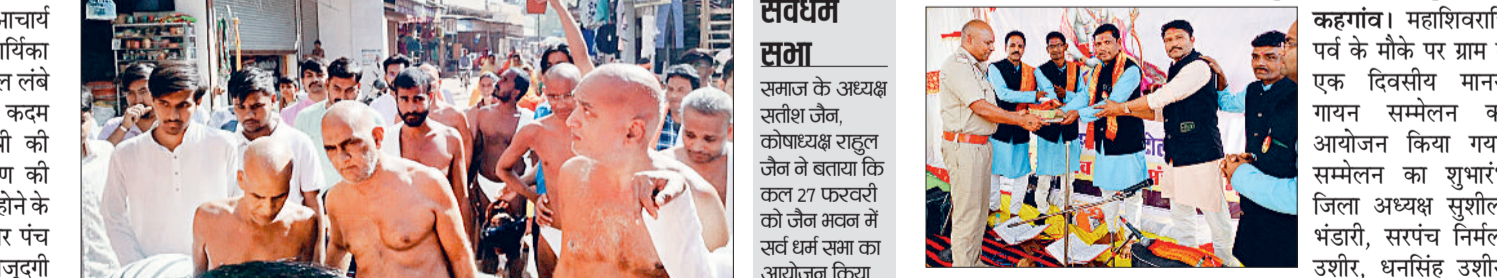
हरिभूमि न्यूज ▶ गंडई पंडरिया

शिवालयों में सुबह से शाम तक जारी रहा पूजा अर्चना का दौर