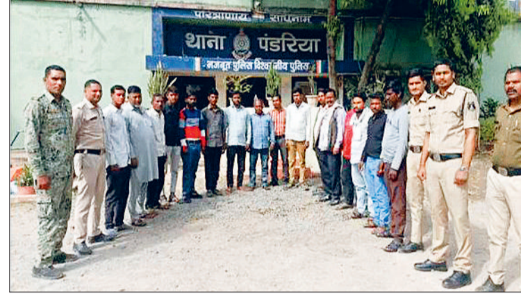
पुलिस द्वारा सघन जांच की गई, जिसमें उनके द्वारा जानबूझकर सही जानकारी छिपाने की

इस संदर्भ में पंडरिया पुलिस से मिली जानकारी के अनुसार चिन्हित कर पकड़े गए संदिग्धों ने पूछताछ के दौरान अपनी पहचान व निवास स्थान के संबंध में स्पष्ट जानकारी नहीं दी तथा पुलिस को लगातार गुमराह करने का प्रयास किया गया। इस पर उनकी गतिविधियों को संदिग्ध मानते हुए