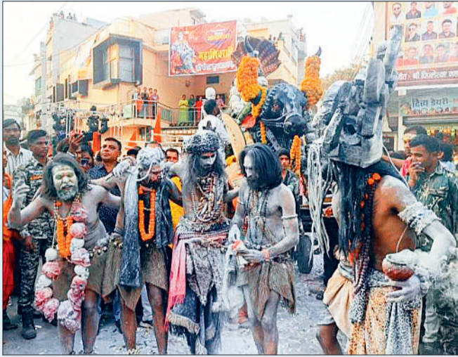
बारात में शामिल भूत, प्रेत रहे आकर्षण का केन्द्र

महाशिवरात्रि का पावन पर्व जहां धर्म नगरी कवर्धा सहित पूरे अंचल में शिव आराधना के साथ धूमधाम व हर्षोल्लास के साथ मनाया गया वहीं कवर्धा नगर में शिव भक्तों द्वारा इस पावन अवसर पर भगवान महाकाल की गाजे-बाजे, शंख, घंट, आतिशबाजी के साथ भव्य बारात निकाली गई। जिसमें तमाम शिव गणों के साथ सैकड़ों की संख्या में शिव भक्त शामिल हुए। पूर्व निर्धारित कार्यक्रम के तहत महा शिवरात्रि के पावन मौके पर नगर के पंचमुखी बुद्ध महादेव मंदिर में दोपहर करीब 2.30 बजे विधिवत मंत्रोच्चार के साथ पूजा अर्चना कर भगवान महाकाल का महाअभिषेक किया गया। तत्पश्चात शाम 4.00 बजे मंदिर परिसर से भगवान महाकाल की भव्य बारात निकाली गई। जिसमें एक सजे धजे रथ में भगवान महाकाल की आकर्षक तथा मनमोहक झांकी सजाई गई थी। इस रथ के आगे नृत्यों की टोली, डीजे साउंड, गाजा-बाजा सहित विभिन्न वेषभूषा में शिवगणों की टोली व शिवभक्त नाचते गाते चल रहे थे। इस दौरान कई सामाजिक संगठनों ने बारात का स्वागत भी किया। महाकाल की यह बारात बुद्ध महादेव मंदिर से पूजा अर्चना के साथ प्राग्भ होकर बुद्ध महादेव से शीतला मंदिर, सरपा मार्ग से ऋषभदेव चौक, एकला चौक, सिमल चौक गायत्री मंदिर चौक से भारतमाता चौक होते हुए महामाया मंदिर के सामने पहुंची। जहां धूमधाम से शिव-गौरी का विवाह संपन्न कराया गया और शिव जी का भस्म श्रृंगार एवं महाआरती की गई। इस दौरान समिति ने यहां अन्य कई आयोजन किए। जिसमें सैकड़ों की संख्या में शिवभक्त शामिल हुए और शिव विवाह के साक्षी बने।