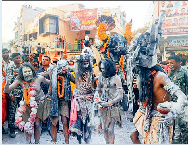
बारात में शामिल भूत, प्रेत रहे आकर्षण का केन्द्र

महाशिवरात्रि का पावन पर्व जहां धर्म नगरी कवर्धा सहित पूरे अंचल में शिव आराधना के साथ धूमधाम व हर्षोल्लास के साथ मनाया गया वहीं कवर्धा नगर में शिव भक्तों द्वारा इस पावन अवसर पर भगवान महाकाल की गाजे-बाजे, शंख, घंट, आतिशबाजी के साथ भव्य बारात निकाली गई। जिसमें तमाम शिव गणों के साथ सैकड़ों की संख्या में शिव भक्त शामिल हुए। पूर्व निर्धारित कार्यक्रम के तहत महा शिवरात्रि के पावन मौके पर नगर के पंचमुखी बुद्ध महादेव मंदिर में दोपहर करीब 2.30 बजे विधिवत मंत्रोच्चार के साथ पूजा अर्चना कर भगवान महाकाल का महाअभिषेक किया गया। तत्पश्चात शाम 4.00 बजे मंदिर परिसर से भगवान महाकाल की भव्य बारात निकाली गई। जिसमें एक सजे धजे रथ में भगवान महाकाल की आकर्षक तथा मनमोहक झांकी सजाई गई थी। इस रथ के आगे नृत्यों की टोली, डीजे साउंड, गाजा-बाजा सहित विभिन्न वेषभूषा में शिवगणों की टोली व शिवभक्त नाचते गाते चल रहे थे। इस दौरान कई सामाजिक संगठनों ने बारात का स्वागत भी किया। महाकाल की यह बारात बुद्ध महादेव मंदिर से पूजा अर्चना के साथ प्राग्भ होकर बुद्ध महादेव से शीतला मंदिर, सरपा मार्ग से ऋषभदेव चौक, एकला चौक, सिमल चौक गायत्री मंदिर चौक से भारतमाता चौक होते हुए महामाया मंदिर के सामने पहुंची। जहां धूमधाम से शिव-गौरी का विवाह संपन्न कराया गया और शिव जी का भस्म श्रृंगार एवं महाआरती की गई। इस दौरान समिति ने यहां अन्य कई आयोजन किए। जिसमें सैकड़ों की संख्या में शिवभक्त शामिल हुए और शिव विवाह के साक्षी बने।