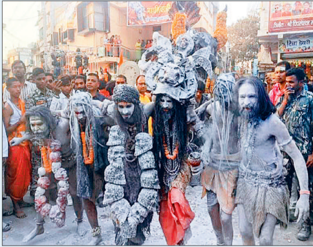
महाशिवरात्रि को लेकर भक्तों में दिखा उत्साह

इस बार नगर में निकाली गई भगवान महाकाल की बारात में हरियाणा से शामिल होने पहुंचे भूप्रेत का दल नगरवासियों के लिए आकर्षण का केन्द्र रहा। करीब दर्जनभर कलाकारों के इस दल में भगवान भोलानाथ की बारात में एक अजीबे वाहन में शमशान की राख (भस्म) लेकर चल रहा था और मार्ग में कई अजीबे करतब दिखा रहा था। जिसे देख लोग दांतों तले उंगली दबाकर रह गए। इसी प्रकार शोभायात्रा में जीवत झांकी व कुरुक्षेत्र हरियाणा के कलाकारों का प्रदर्शन भी आकर्षण का केन्द्र रहा।