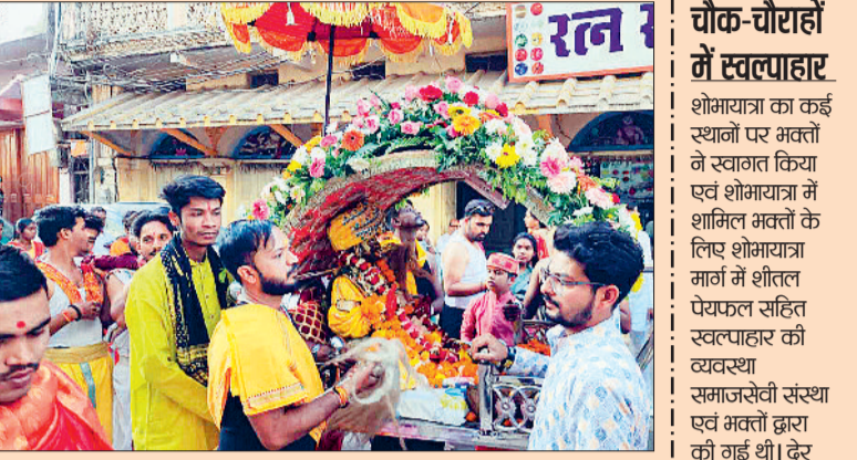
चौक-चौराहों में स्वल्पाहार शोभायात्रा का कई स्थानों पर भक्तों ने स्वागत किया एवं शोभायात्रा में शामिल भक्तों के लिए शोभायात्रा मार्ग में शीतल पेयफल सहित स्वल्पाहार की व्यवस्था समाजसेवी संस्था एवं भक्तों द्वारा की गई थी। देर शाम तक शोभायात्रा में जयकारों की गूंज रही।