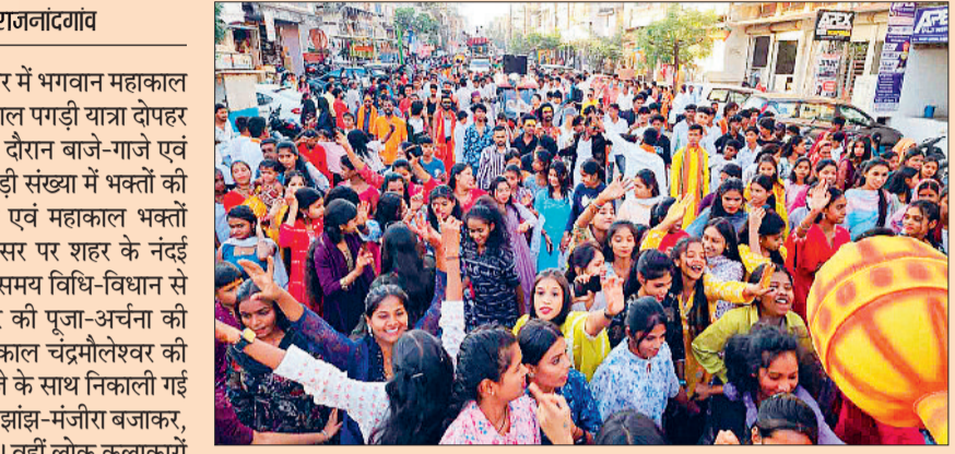
प्रमुख मार्गों से गुजरी : उक्त शोभायात्रा शहर के नंदई कुंआ चौक से सदर बाजार, भारत माता चौक, गंज लाइन, कालीमाई मंदिर, रामाधीन मार्ग, कामठी लाइन, सत्यनारायण मंदिर भारत माता चौक सहित अन्य मार्गों से होते हुए गुजरी। इससे पूर्व सुबह ढाई बजे भगवान महाकाल का महारूपाभिषेक, सुबह साढ़े 3 बजे बाबा को भस्म अर्पण व आरती सुबह 5 बजे श्रृंगार आरती की गई। उक्त शोभायात्रा में बड़ी संख्या में भक्तों की उपस्थिति रही।