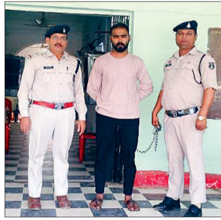
हरिभूमि न्यूज ▶ कवर्धा