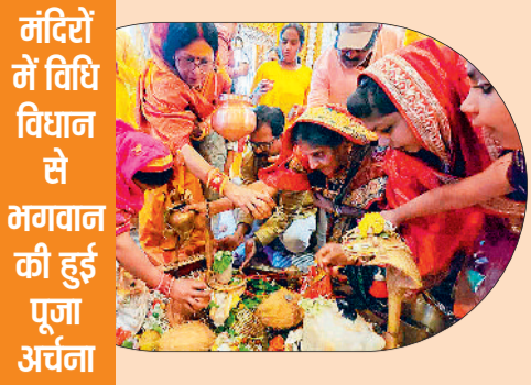
मंदिरों में विधि विधान से भगवान की हुई पूजा अर्चना