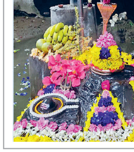
हरिभूमि न्यूज ▶ कवर्धा

हरिभूमि पाण्डुराई। नगर पंचायत पाण्डुराई से 3 किलोमीटर की दूरी में स्थित डोंगरिया स्वयंभू जलेश्वर महादेव घाट में महाशिवरात्रि के अवसर पर प्रातः 4:00 बजे से ही श्रद्धालुओं व भक्तजनों की भारी भीड़ उमड़ी। जहां भक्तजनों द्वारा विधा विधान से पूजा अर्चना कर आशीर्वाद प्राप्त किया। वहीं भक्तजनों द्वारा सुबह से देर रात तक स्नान-दान, पूजा-अर्चना करते रहे। वहीं डोंगरिया देव स्थल प्रांगण पर ही तरह-तरह की दुकान सजी।