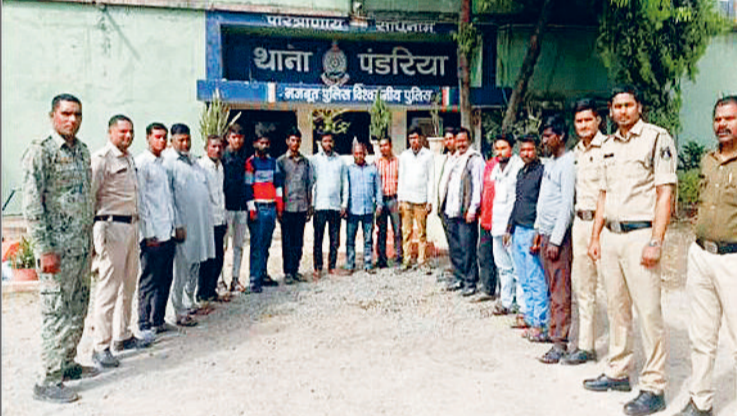
पुलिस द्वारा सघन जांच की गई, जिसमें उनके द्वारा जानबूझकर सही जानकारी छिपाने की

पंडरिया पुलिस ने थाना क्षेत्र में अभियान चलाकर विभिन्न राज्यों से आए 17 संदिग्ध व्यक्तियों को चिन्हित कर उनके खिलाफ कार्यवाही की है। सभी आरोपियों के खिलाफ धारा 128 बी एन एस के तहत प्रकरण दर्ज किया गया है। इस संदर्भ में पंडरिया पुलिस से मिली जानकारी के अनुसार चिन्हित कर पकड़े गए संदिग्धों ने पूछताछ के दौरान अपनी पहचान व निवास स्थान के संबंध में स्पष्ट जानकारी नहीं दी तथा पुलिस को लगातार गुमराह करने का प्रयास किया गया। इस पर उनकी गतिविधियों को संदिग्ध मानते हुए